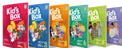
* Libros oficiales de Cambridge.

Trabajamos con libros oficiales de Cambridge para los grupos de primaria y libros oficiales de Cambridge de preparación de examen para los grupos de certificaciones oficiales (Aula Abierta proporcionará la opción de compra directa del libro de texto a través de Cambridge, al ser Cambridge Partner Premium contamos con precios reducidos en comparación con compra externa).